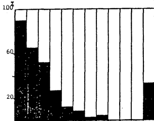
Figure n°1: Evolution du sex-ratio de S. porcus (% des mâles) par classe de taille.

Les plus petites femelles matures mesurent 100 mm de Lst et les plus grandes femelles immatures mesurent 140 mm (Tabl.1). La taille pour laquelle 50 % des femelles sont matures est de 108 mm soit à un âge de 3 ans (BRADAI et BOUAIN, 1988). A partir de 150 mm, la totalité des femelles sont matures. Ces résultats soulignent la grande variabilité de la taille de première maturité sexuelle. Le plus petit mâle observé microscopiquement, susceptible d'émettre de la laitance, mesure 85 mm et est âgé de 2 ans.