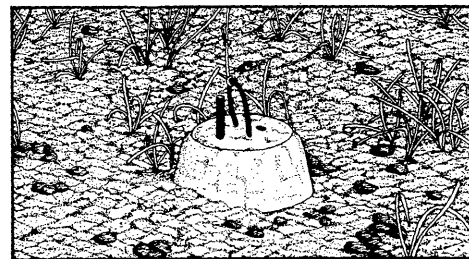
Fig. 2: Schéma, d'après une photo, d'une balise à la limite inférieure de l'herbier. On distingue les faisceaux de feuilles. Site de Carry-le-Rouet (Bouches-du-Rhône). Dessin: Paule FORET.

La mise en place du Réseau de Surveillance Posidonie est maintenant terminée. Il comporte (Fig. 1) 12 balisages profonds et 12 sites superficiels de surveillance par photographies aériennes; d'Ouest en Est: Carry-le-Rouet, Prado (Marseille), La Clotat, Le Brus, Giens, Porquerolles, Saint-Aygulf, Bormes, Cap Lardier, Griemaud, Cannes, Iles de Lérins, Golfe-Juan, Baon et Villefranche-sur-Mer. Les balisages sont installés en profondeur, à la limite inférieure de l'herbier; chaque balisage est constitué par une série de 12 balises en béton (50 kg), à 5 m d'intervalle; elles sont photographiées selon un processus rigoureusement standardisé (Fig. 2); elles servent en outre de repères pour des observations et des prélèvements complémentaires (granulométrie du sédiment, densité des faisceaux, biométrie, lepidochronologie, biomasse des épiphytes, etc.). En ce qui concerne la limite supérieure de l'herbier, des photos aériennes sont prises selon un processus standardisé (altitude, objectif, heure, etc.); elles sont ensuite traitées pour corriger les déformations dues à la paralaxe (ortho-photoplans); sur chaque site, des vérités permettent de sélectionner une dizaine de structures et d'en identifier la nature (intermattes, sable, matte morte, tombants de matte) et la position. Le retour sur chaque site (balisages profonds et sites superficiels) s'effectue avec un pas de temps de trois ans.