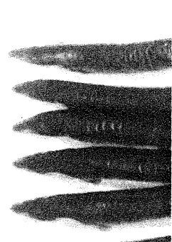
Fig.1 : Migrating silver Eels with narrow heads and pointed snout

The Eels catch extremely increased in periods coincided with the waning of the moon. Rainfall played the same role of increasing the catch of fyke nets distributed in four different areas inside the lake, especially in nights of full moon as shown in Fig. 2 which represented the catch of an area located near the lake-sea opening.